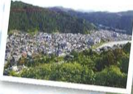
絶景スポット 城下町が一望できる

新緑のもみじはもちろん、サツキやツツジ等の初夏の花々も魅力的！ 自然に抱かれた山城を お楽しみください。